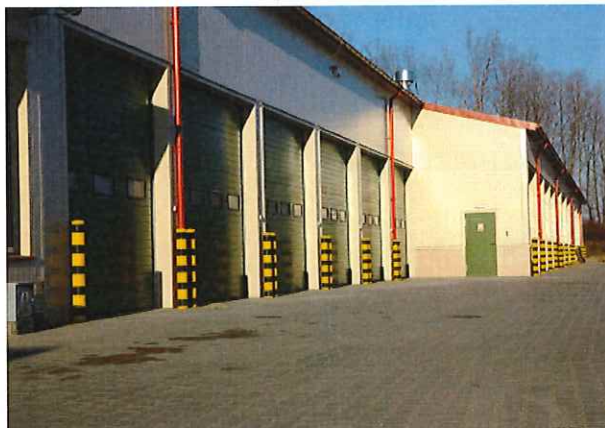
Garáže ob. 501

A handwritten signature in blue ink, consisting of a stylized 'P' followed by a cursive 'H'.