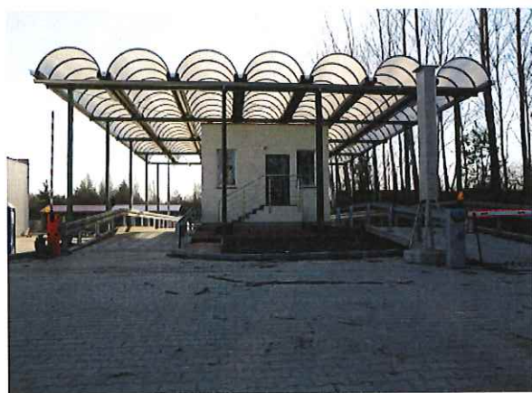
Budynek obsługi wag