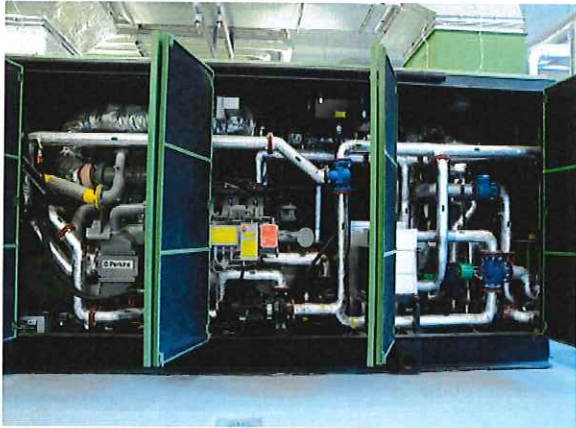
Bioelektrownia – Kogenerator