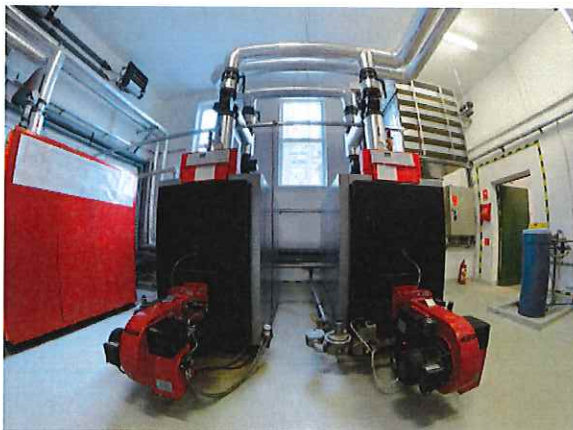
Bioelektrownia – Kotły