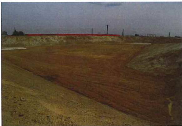
Kwaterna składowania azbestu

A handwritten signature in blue ink, consisting of several loops and a long tail, located in the bottom right corner of the page.