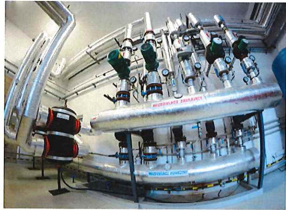
Bioelektrownia – Kociołownia