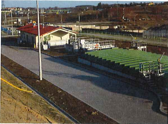
Podczyszczalnia ścieków i odcieków