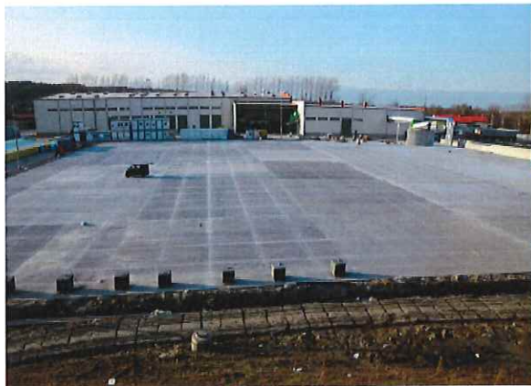
Budynek sortowni i kompostowni